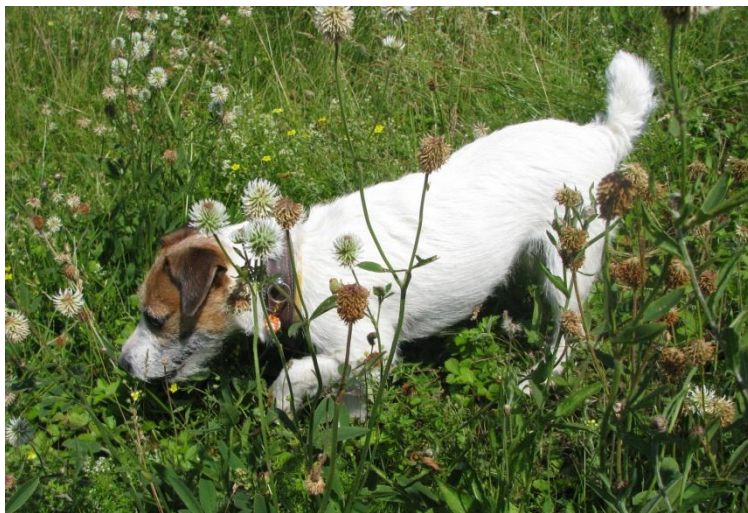
Рис. 3. Пример оформления рисунка и подписи

Для оформления подписи к иллюстрации используйте стиль «Иллюстрация (название)». В конце подписи к рисунку точка не ставится. На каждый рисунок в тексте работы должна быть ссылка, например: «На Рис. 3 изображена собака».